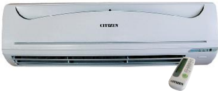
model: Inspirational CSRA - 18, 26